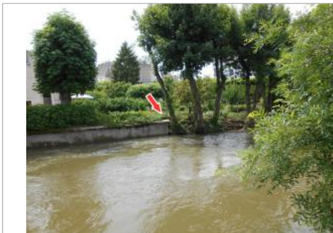
Site et repère de la crue de juin 2016