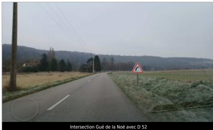
Intersection Gué de la Noé avec D 52