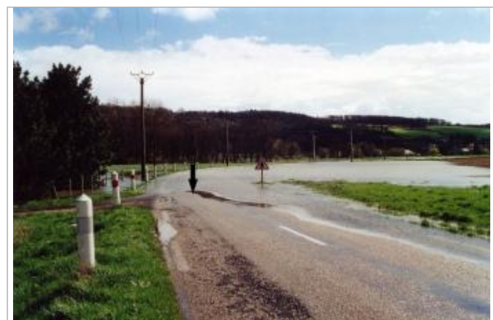
Intersection Gué de la Noé avec D 52