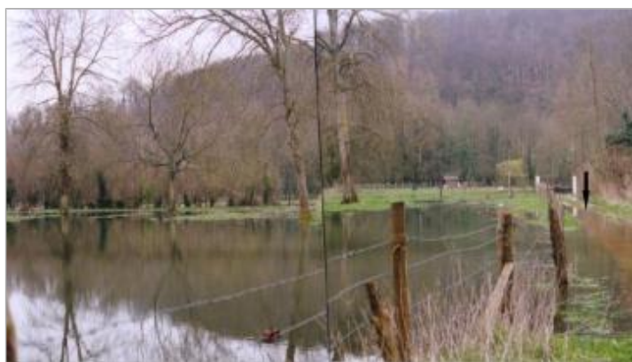
Chemin des Foulons