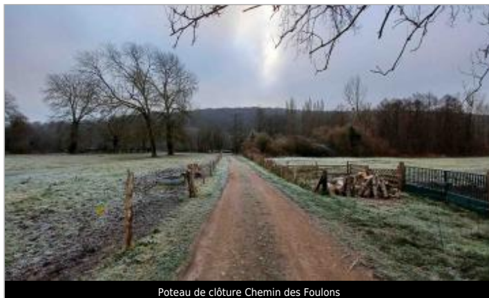
Poteau de clôture Chemin des Foulons

Coordonnées WGS84 : X: 1.15834000 / Y: 49.14999000