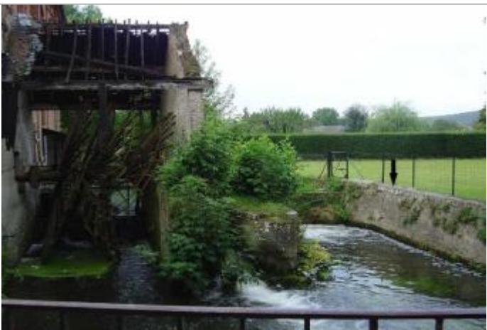
Rue des Grandes Ruelles (photo ISL)

Altitude calculée de l'eau (en m) : 18.18 m