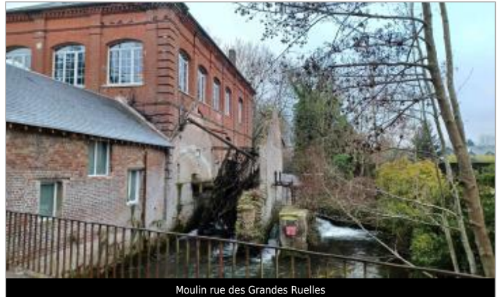
Moulin rue des Grandes Ruelles