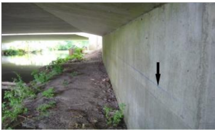
Franchissement de la RN154 par le bras naturel de l'Iton