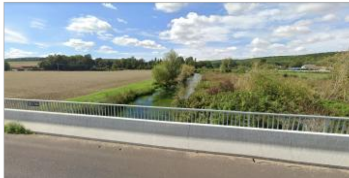
Pont de la RN154 sur l'Iton