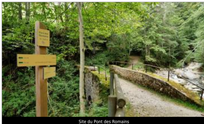
Site du Pont des Romains