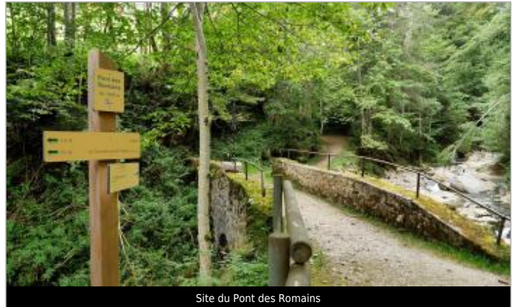
Site du Pont des Romains