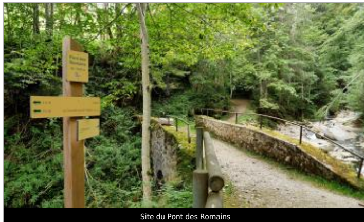
Site du Pont des Romains