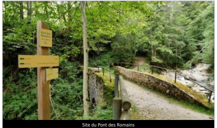
Site du Pont des Romains