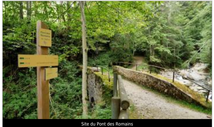
Site du Pont des Romains