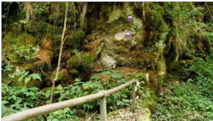
pont des Romains, crue de 1987