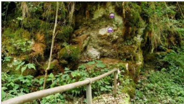
pont des Romains, crue de 1987