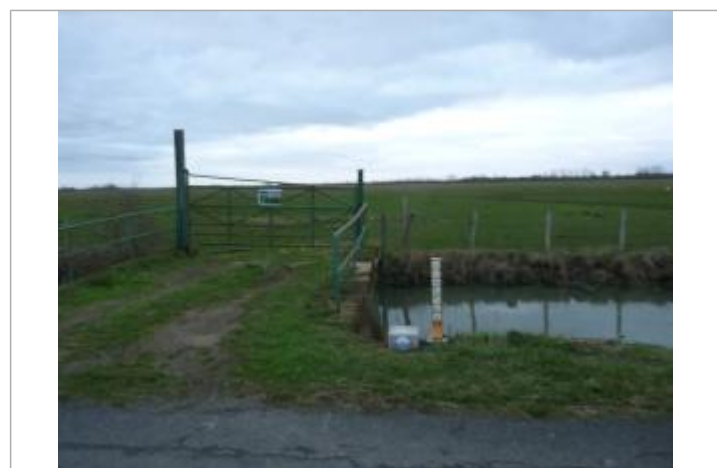
Plaque sur borne béton