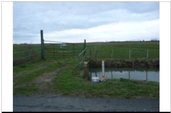
Plaque sur borne béton

GÉNÉRAL Code : WEB_R_201710262454 Date de mise à jour : 06/04/2022 Auteur : PAPI-SMVSA