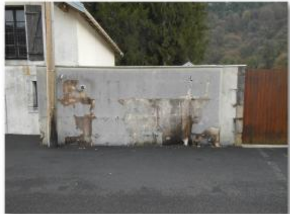
Mur d'enceinte - maison éclusière de Casamène

Coordonnées WGS84 : X: 6.02336490 / Y: 47.21928100