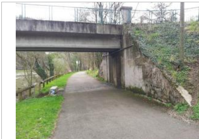
Pile de la passerelle Mazagran, rive droite