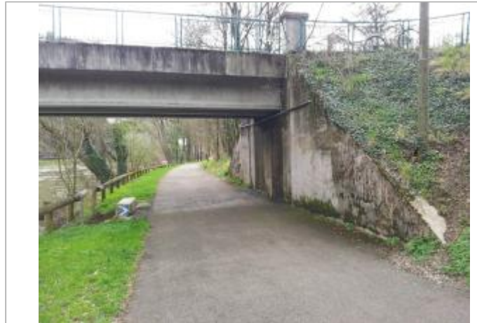
Pile de la passerelle Mazagran, rive droite