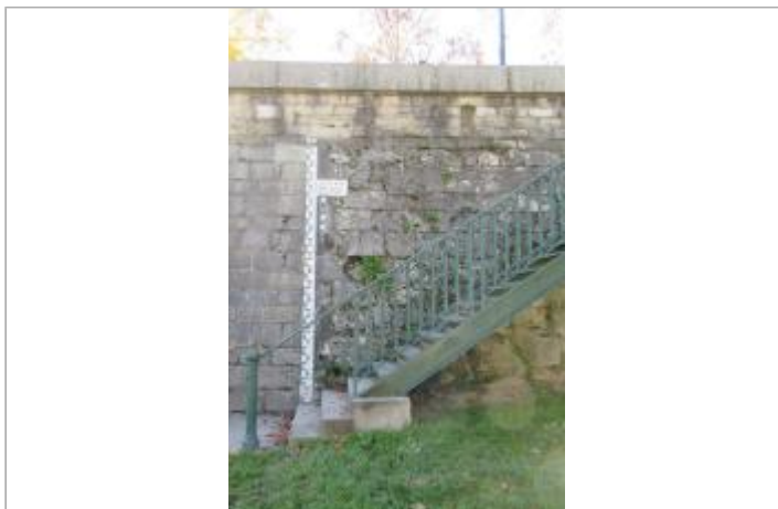
Echelle limimétrique du pont de la République