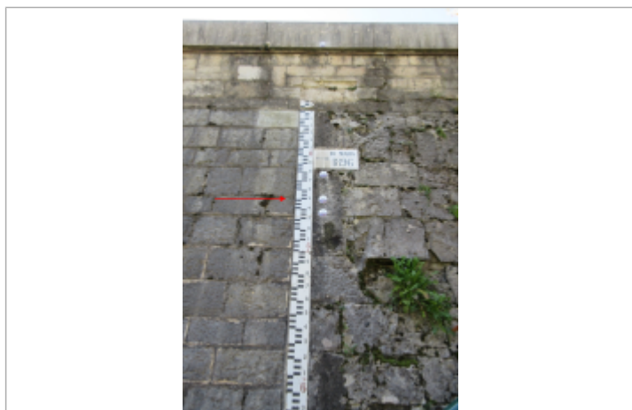
Pont de la République - Q1983

Code : 2017_EPTBQ1983_Rep Date de mise à jour : 24/04/2018