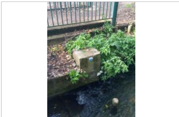
ancien ouvrage de gestion