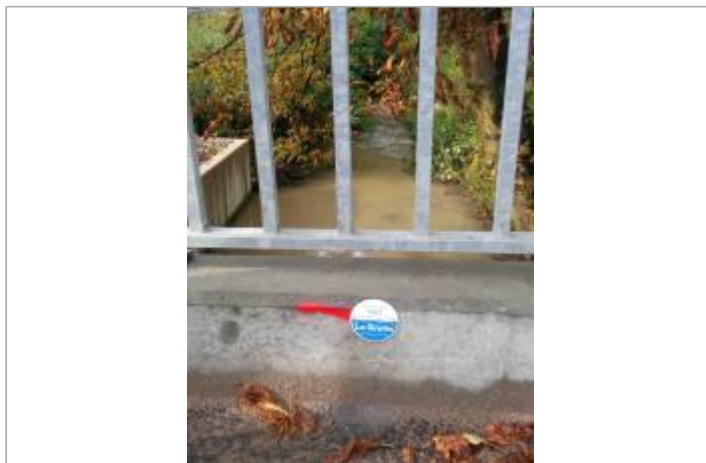
site du repère