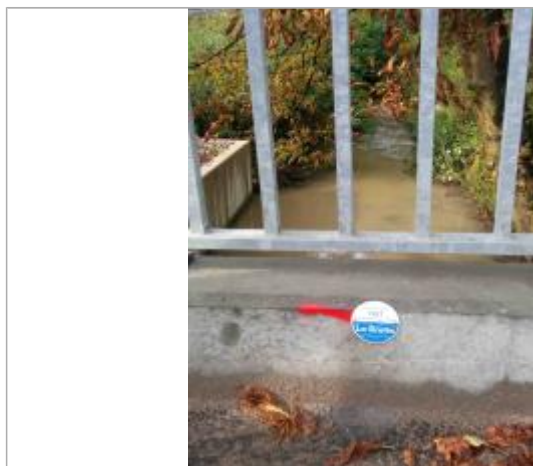
repère crue 17/07/1987