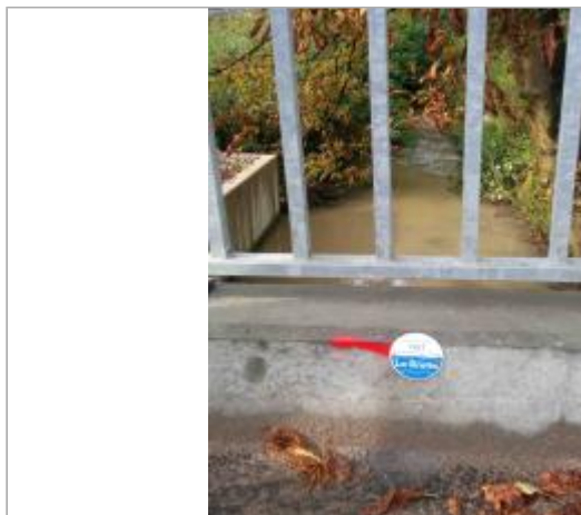
site du repère