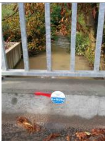
repère crue 17/07/1987

Altitude calculée de l'eau (en m) : 61.98