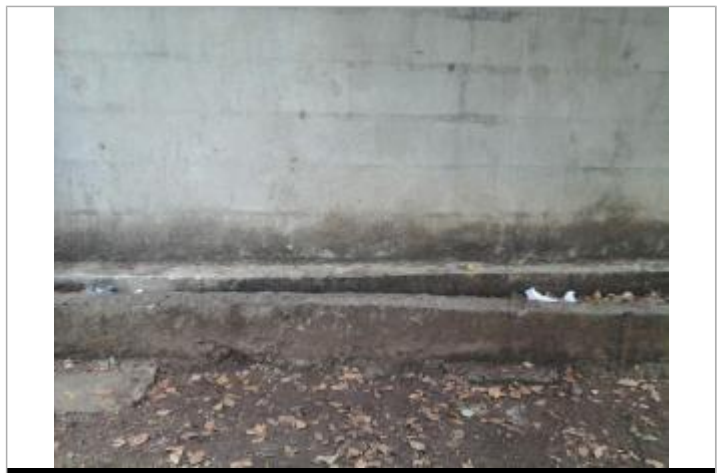
Zoom sur la laisse de crue

GÉNÉRAL Code : WEB_R_201710245414 Date de mise à jour : 24/08/2020 Auteur : G. Jestin - ETG Mayotte