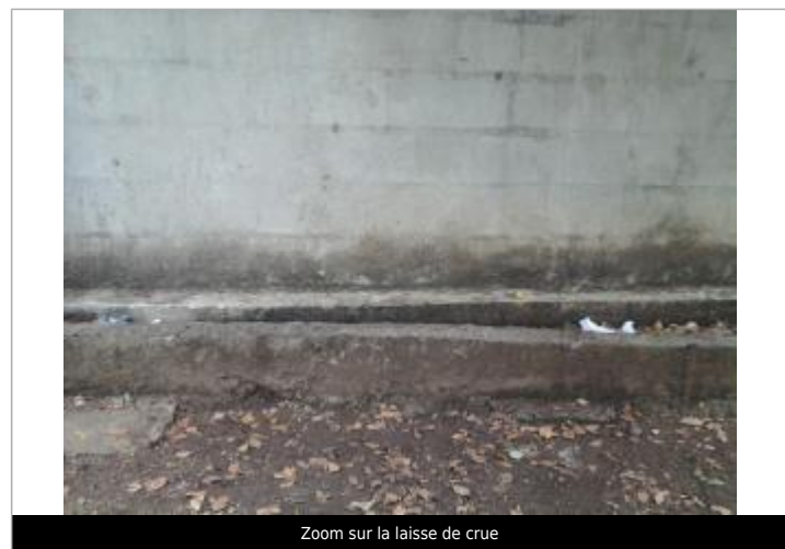
Zoom sur la laisse de crue