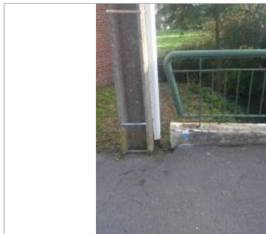
site du repère