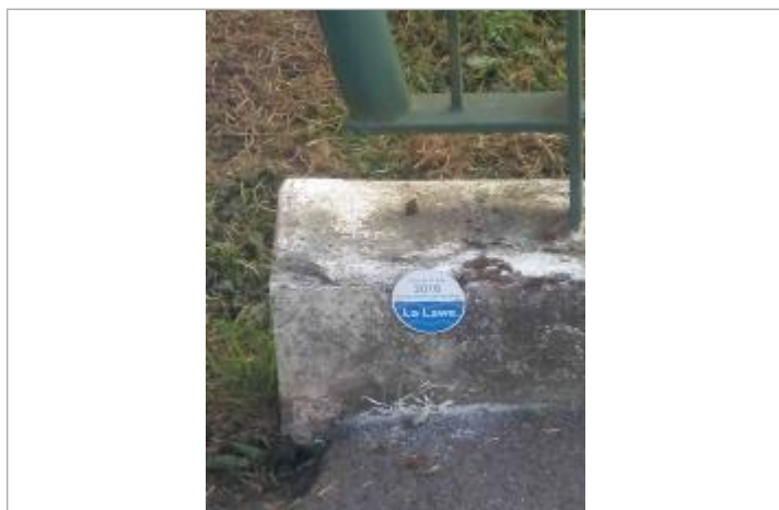
repère crue 31/05/2016