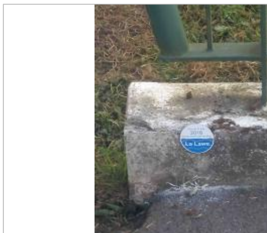
repère crue 31/05/2016