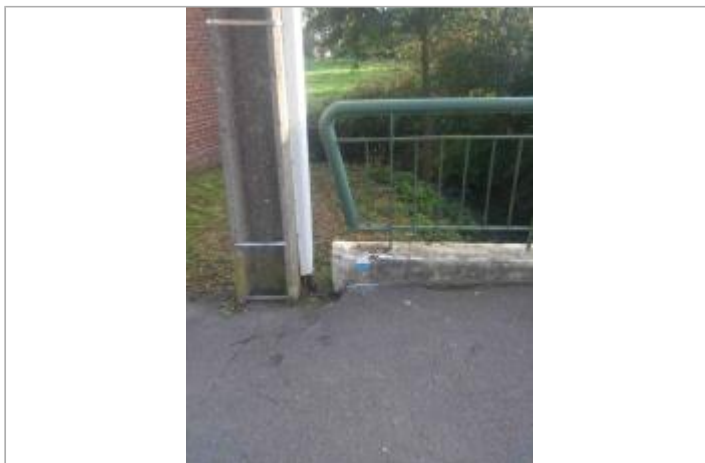
site du repère