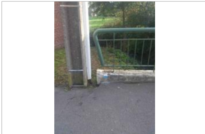
site du repère