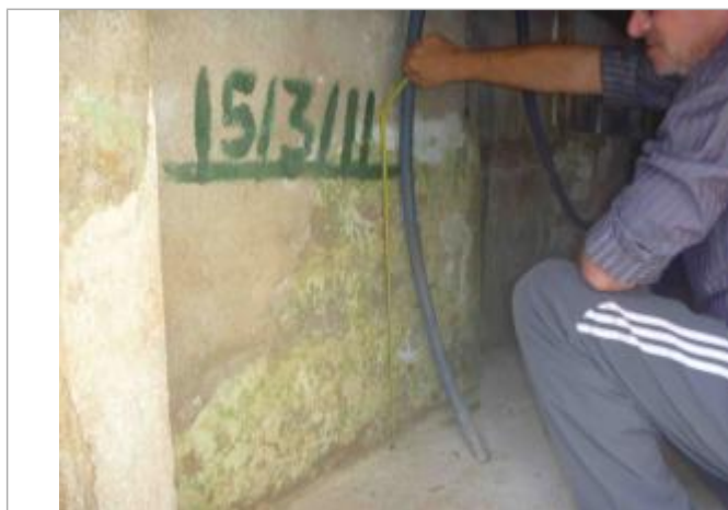
Rue de la Grande Fontaine 4, crue 15 mars 2011, hauteur 67 cm