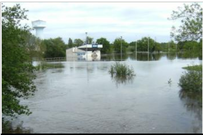
Site pendant la crue de mai 2015

GÉOLOCALISATION Coordonnées WGS84 : X: 2.05675630 / Y: 47.43125900 Coordonnées RGF93 (Lambert 93) : X: 628900.14 / Y: 6703858.92 Coordonnées RGF93 (ETRS89) : X: 2.0567563 / Y: 47.431259 Code Hydro: K6--0250 Rive de référence: Gauche