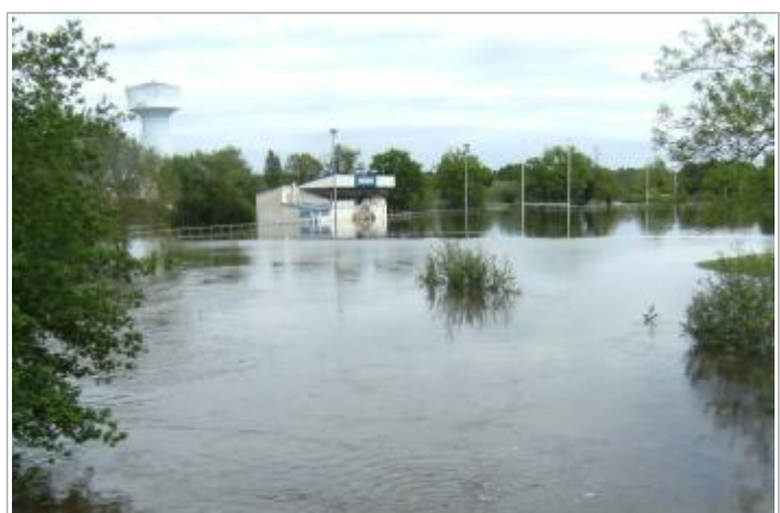
Site et repère de la crue de mai 2015

MARQUE Visibilité : Oui État du repère : Bon Pérennité : Longue