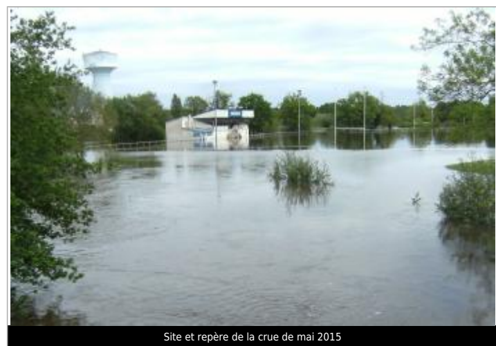
Site et repère de la crue de mai 2015