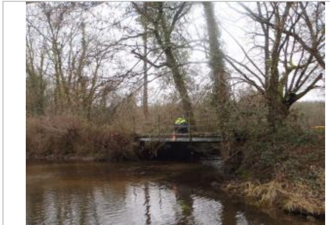
Site (source : CEREMA Normandie-Centre)

Coordonnées WGS84 : X: 2.38911100 / Y: 47.50681400