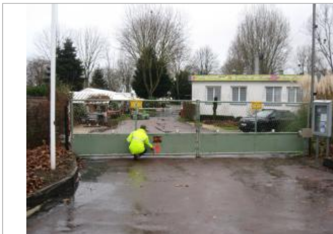
Site