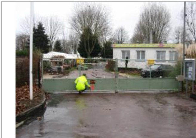
Site