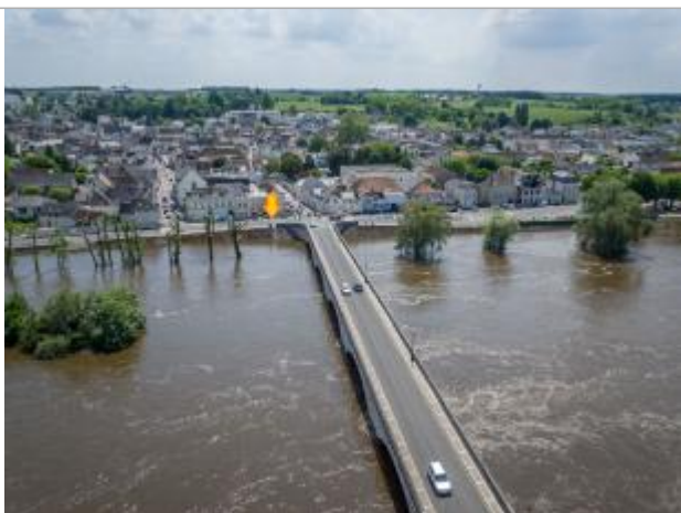
Vue de la photo en juin 2016

Altitude calculée de l'eau (en m) : 55.448 m