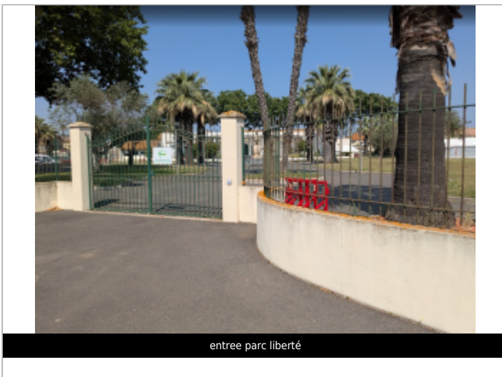
entree parc liberté