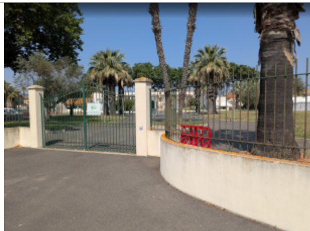
entree parc liberté

Coordonnées RGF93 (ETRS89) : X: 3.2838416 / Y: 43.3133512