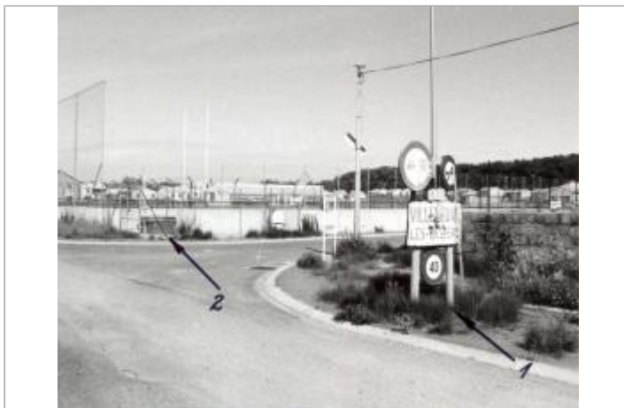
Photo du site