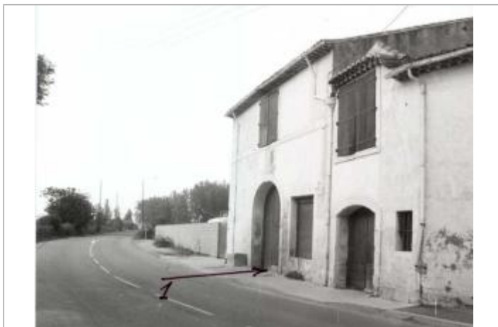
Photo du site