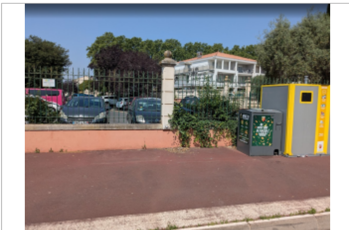
site rue leon lagarde