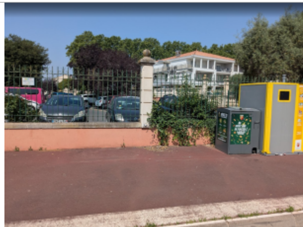
site rue leon lagarde

Coordonnées WGS84 : X: 3.27926129 / Y: 43.31631970