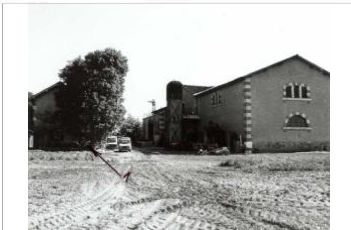
Photo du site