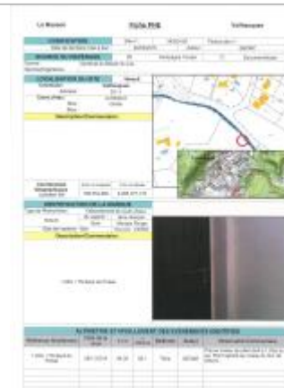
Fiche du site

Coordonnées RGF93 (ETRS89) : X: 3.7233135 / Y: 43.6650281