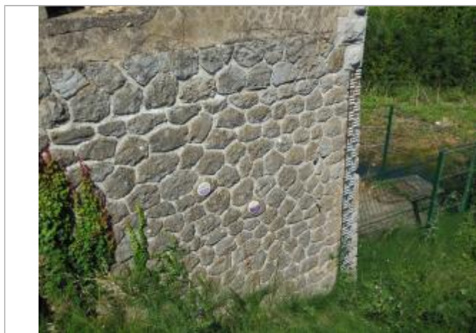
vue des repères à coté de l'échelle