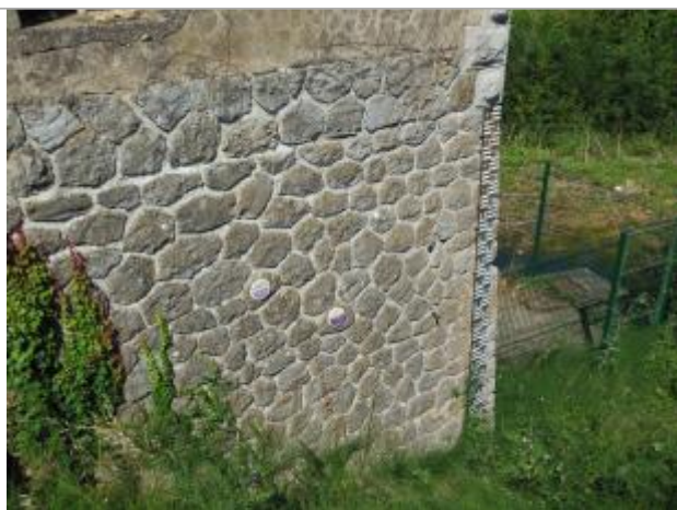
vue des repères à coté de l'échelle