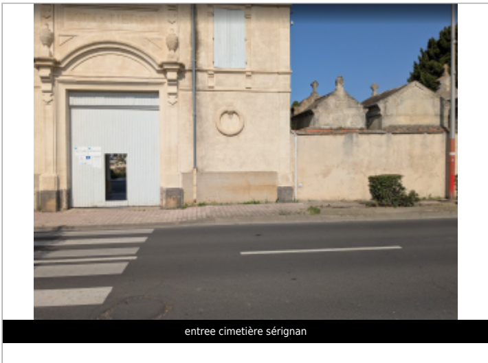
entree cimetiere serignan