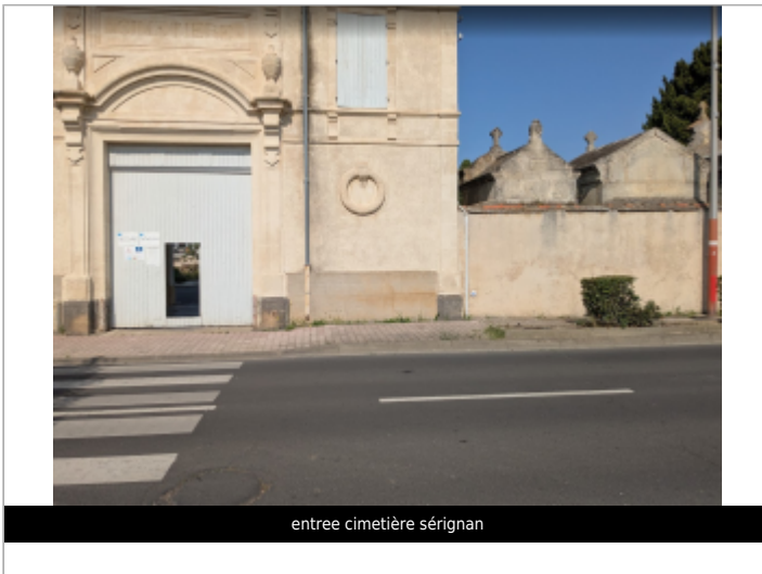
entree cimetière sérignan