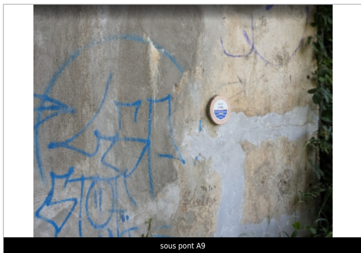
sous pont A9

Maximum de l'inondation : Oui Visibilité : Oui État du repère : Bon Pérennité : Longue Repère calculé : Non renseigné PHEC : Non renseigné