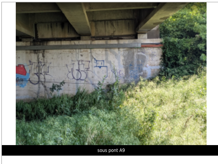
sous pont A9