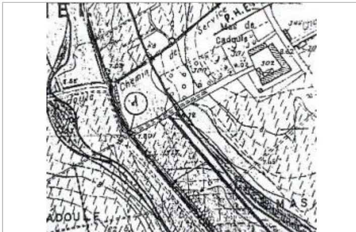
Croquis du site