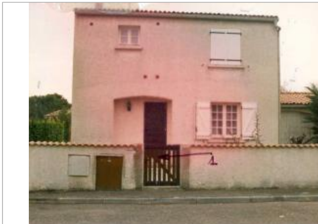
Photo du site