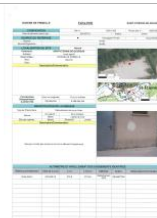
Fiche du site

Coordonnées RGF93 (ETRS89) : X: 3.3797905 / Y: 43.7683363