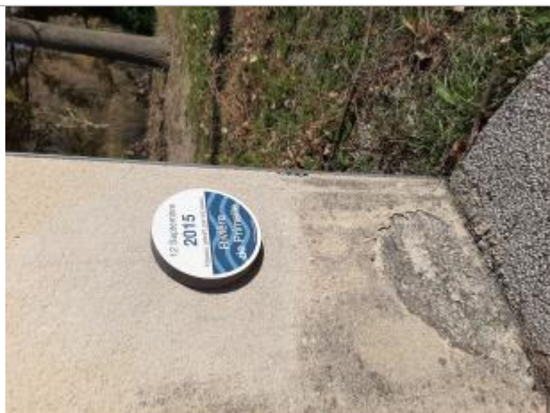
repère posé sur le viestaire du stade