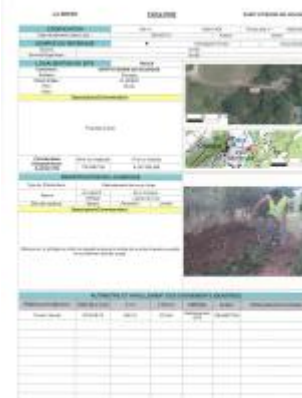
Fiche du site

Coordonnées RGF93 (ETRS89) : X: 3.3812664 / Y: 43.7794153