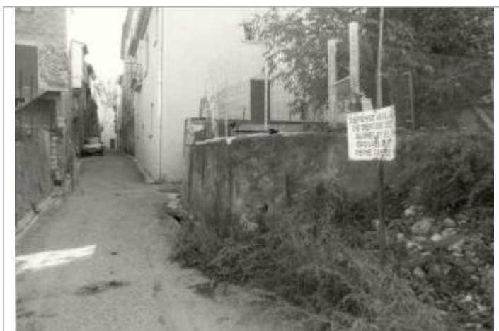
Photo du site

GÉOLOCALISATION Coordonnées WGS84 : X: 3.73347329 / Y: 43.89484320 Coordonnées RGF93 (Lambert 93) X: 758936.79 / Y: 6310922.3 Coordonnées RGF93 (ETRS89) : X: 3.7334733 / Y: 43.8948432