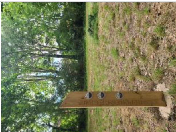
Totem de crue monté des repères de crue

Altitude calculée de l'eau (en m) : 10.94 m