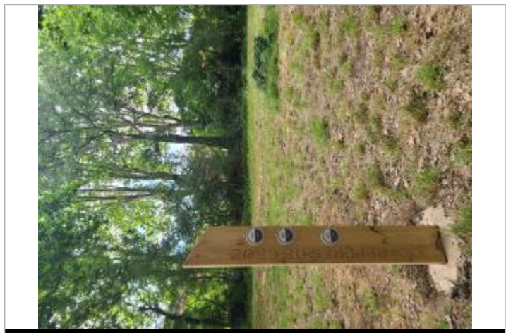
Totem de crue monté des repères de crue

MARQUE Maximum de l'inondation : Oui Visibilité : Oui État du repère : Bon Pérennité : Longue Repère calculé : Non renseigné PHEC : Non