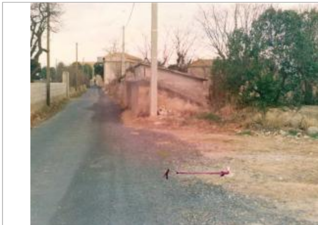
Photo du site