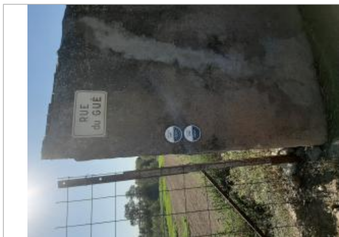
entrée de Conas, différents repères