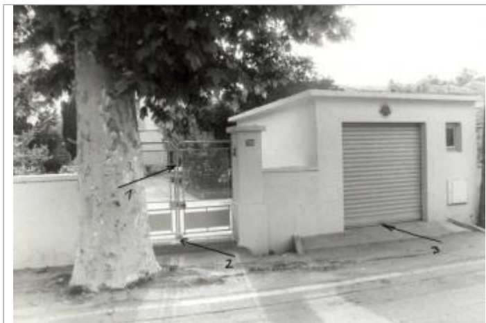
Photo du site