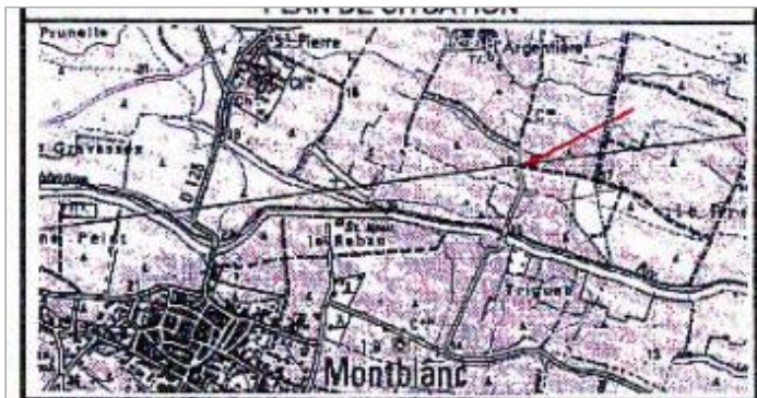
Croquis du site