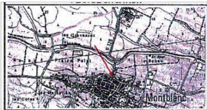
Croquis du site