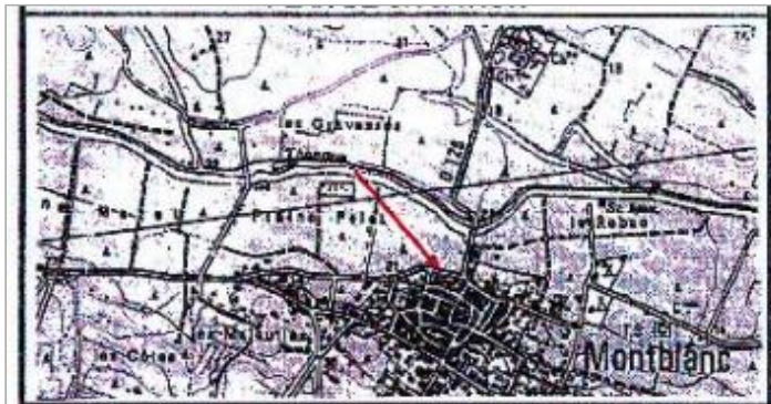
Croquis du site