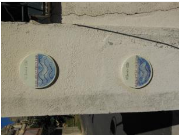
repères sur pilier à l'entrée du domaine

Altitude calculée de l'eau (en m) : 22.62 m